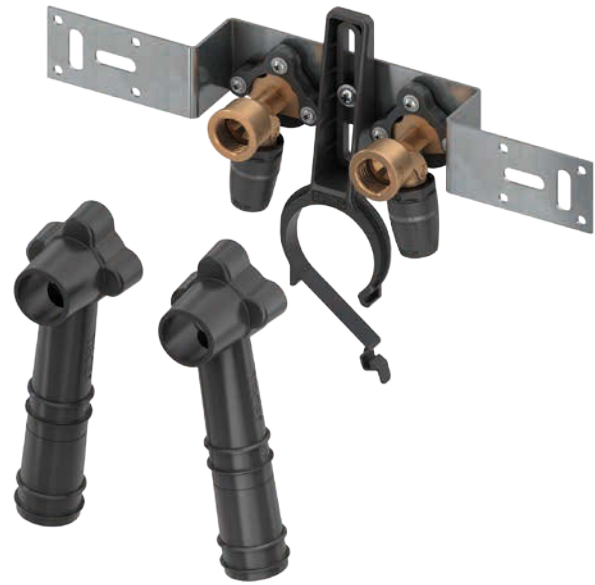
TECElogo montagebeugel met geluiddempende afdekkappen