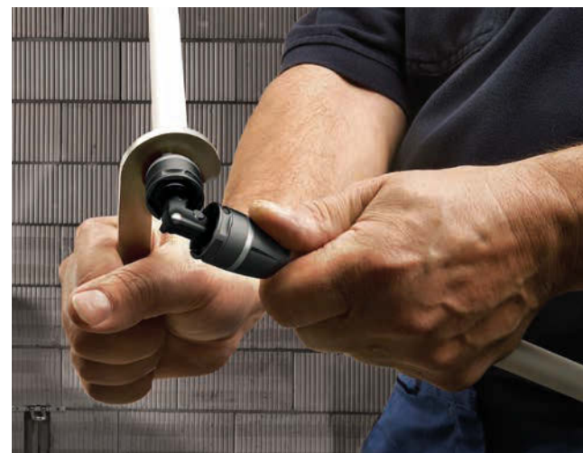
Eenvoudig demonteerbare verbindingen, zonder dat de buis en klemring beschadigen