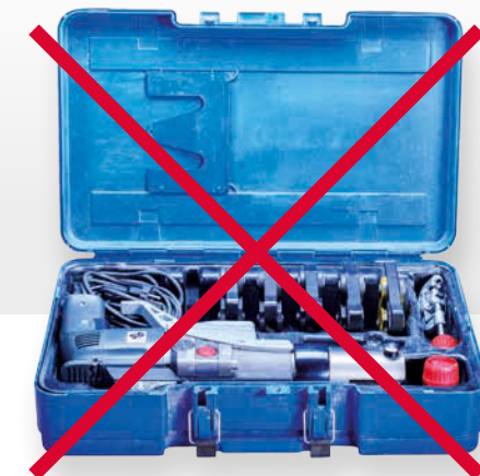
Koffer met persmachine 50x35x20cm