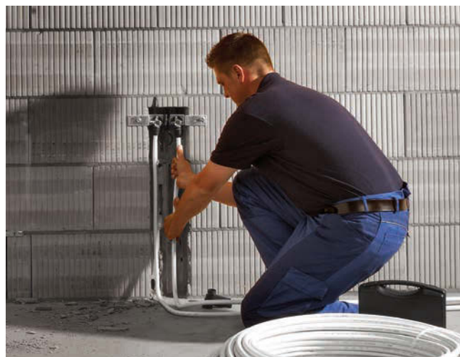
Eenvoudige montage in een krappe ruimte

Wat is zwaarder: persgereedschap of uw handen? Een duidelijke zaak: immers wie voor het installeren alleen zijn handen nodig heeft, heeft het een stuk makkelijker. Vooral bij bovenhands werken.