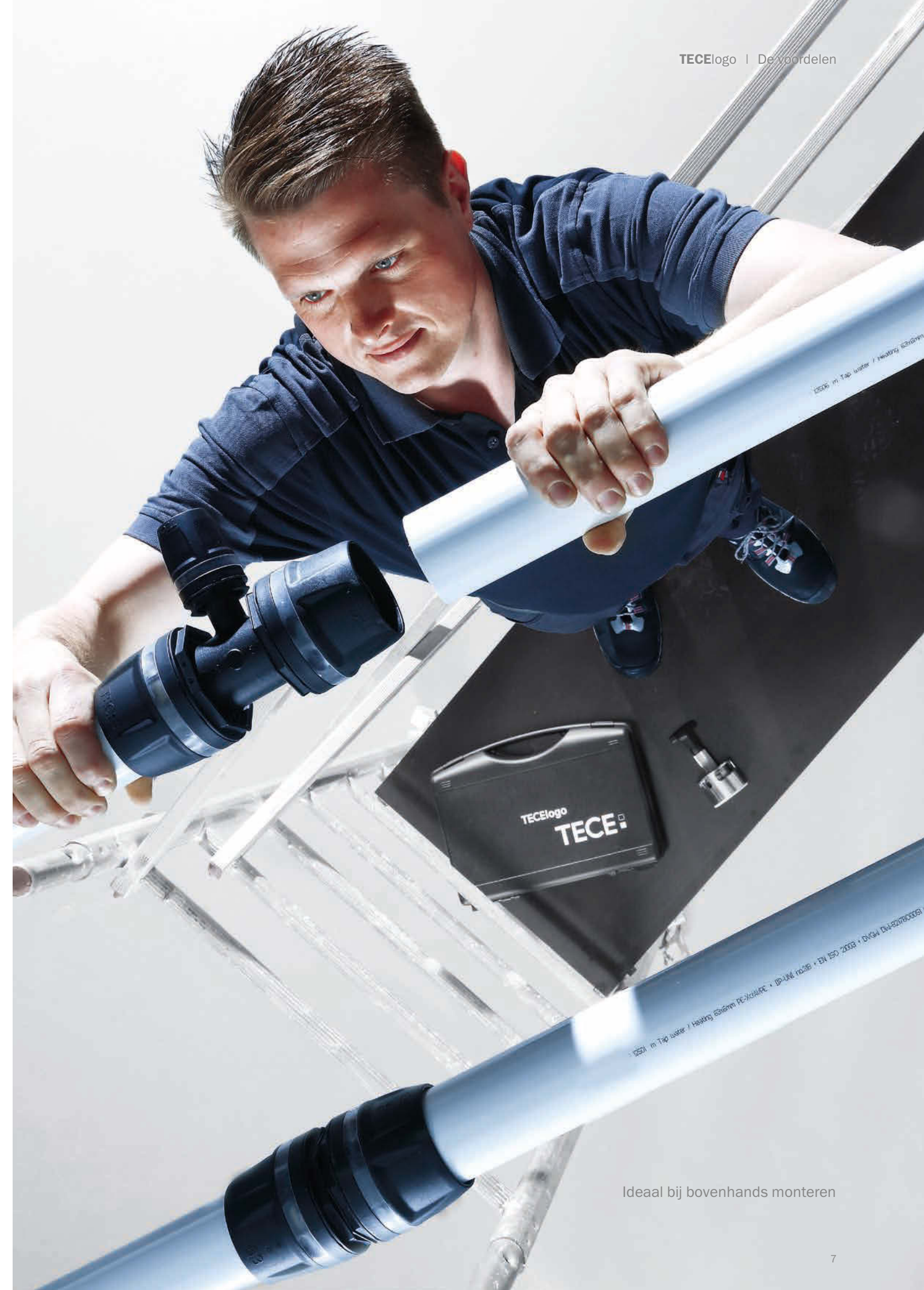
Ideaal bij bovenhands monteren