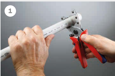
1 Op lengte maken

Zo eenduidig, ongecompliceerd en snel monteert u het professionele systeem TECElogo: (1) op lengte maken, (2) kalibreren, (3) steken en klaar.