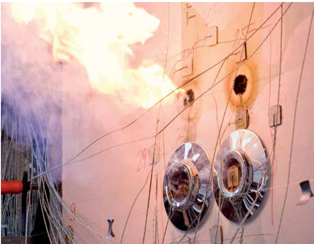
Brandtest bij het testinstituut Materialprüfanstalt für das Bauwesen in Braunschweig. Afhankelijk van de uitvoering van de sanitairwand werden er bij eenzijdige brandbelasting brandweerstandsklassen tot F 120 bereikt.

Geteste en gecertificeerde systeemoplossingen zijn in het belang van alle betrokkenen, of het nu gaat om planners, gebouwexploitanten of gebruikers. Om de hoogste veiligheidsnormen te garanderen, besteedt TECE altijd de vereiste aandacht aan dit onderwerp. Zeker wanneer het om bescherming tegen lawaai en brand gaat.