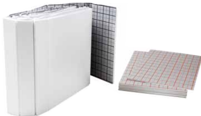
Jeweils 10 m 2 – die TECEfloor 10plus ist in jeder Hinsicht einfach zu handhaben.