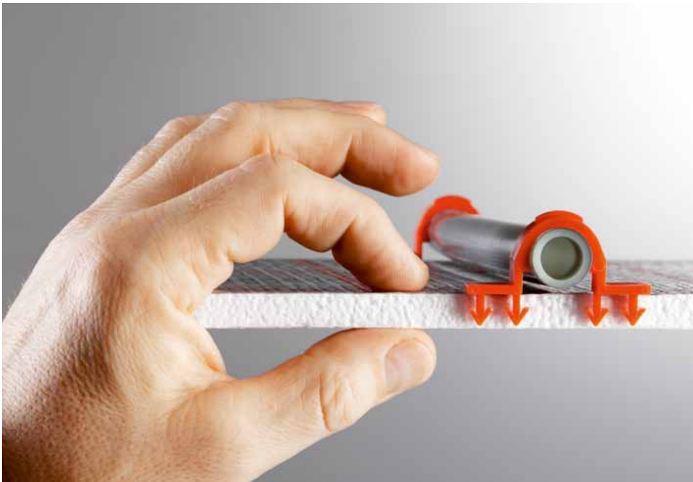
Nur 10 mm stark – die TECEfloor Tackerplatte 10plus

Egal welche Anforderungen an Wärmedämmung, Trittschallschutz, Verkehrslast oder Aufbauhöhe gestellt werden: die Zusatzdämmung variiert, die Tackerplatte ist immer die gleiche.